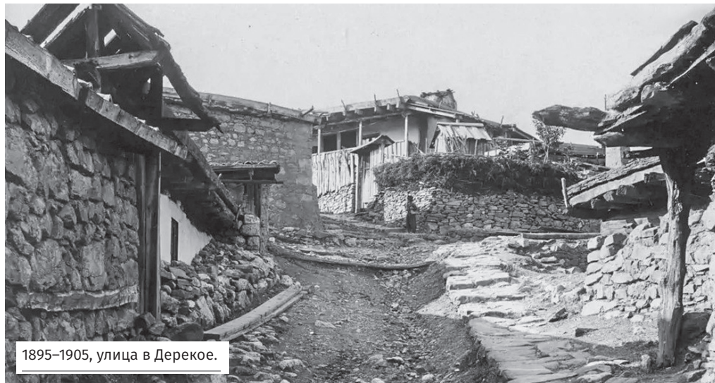
1895–1905, улица в Дерекое.

В 1945 году село переименовали в Ущельное. Изме-