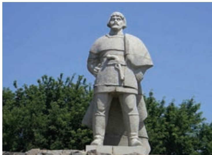
Саранск. Памятник Емельяну Пугачёву.