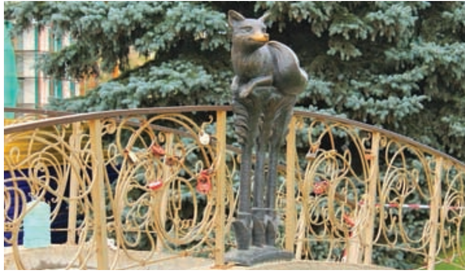
Саранск. Лисий мостик

Мордовия располагается примерно посередине между Москвой и Волгой. Она является самой ближней к Москве российской республикой: расстояние по автодороге от МКАДа до западной границы Мордовии – 398 км, а по прямой – 330 км. Правда, административно Мордовия относится не к Центральному, а к Приволжскому федеральному округу. В Мордовии 7 городов, 13 посёлков городского типа и 1250 сельских населённых пунктов. Население Мордовии – 850 000 человек. Площадь республики – 26 128 кв. км, протяжённость с запада на восток – около 280 км, с севера на юг – до 140 км. Промышленность Мордовии представлена машиностроением, электротехническим и перерабатывающим производством, строительным комплексом и сельским хозяйством.