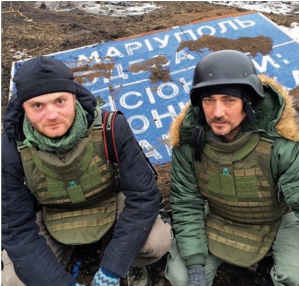
Военные корреспонденты чаще всего оказываются вне объективов фотоаппаратов и видеокамер.

– Мы рады, что приехали в Крым, – говорит видеооператор Дмитрий Стешин. – Я два года подряд приезжаю по редакци-