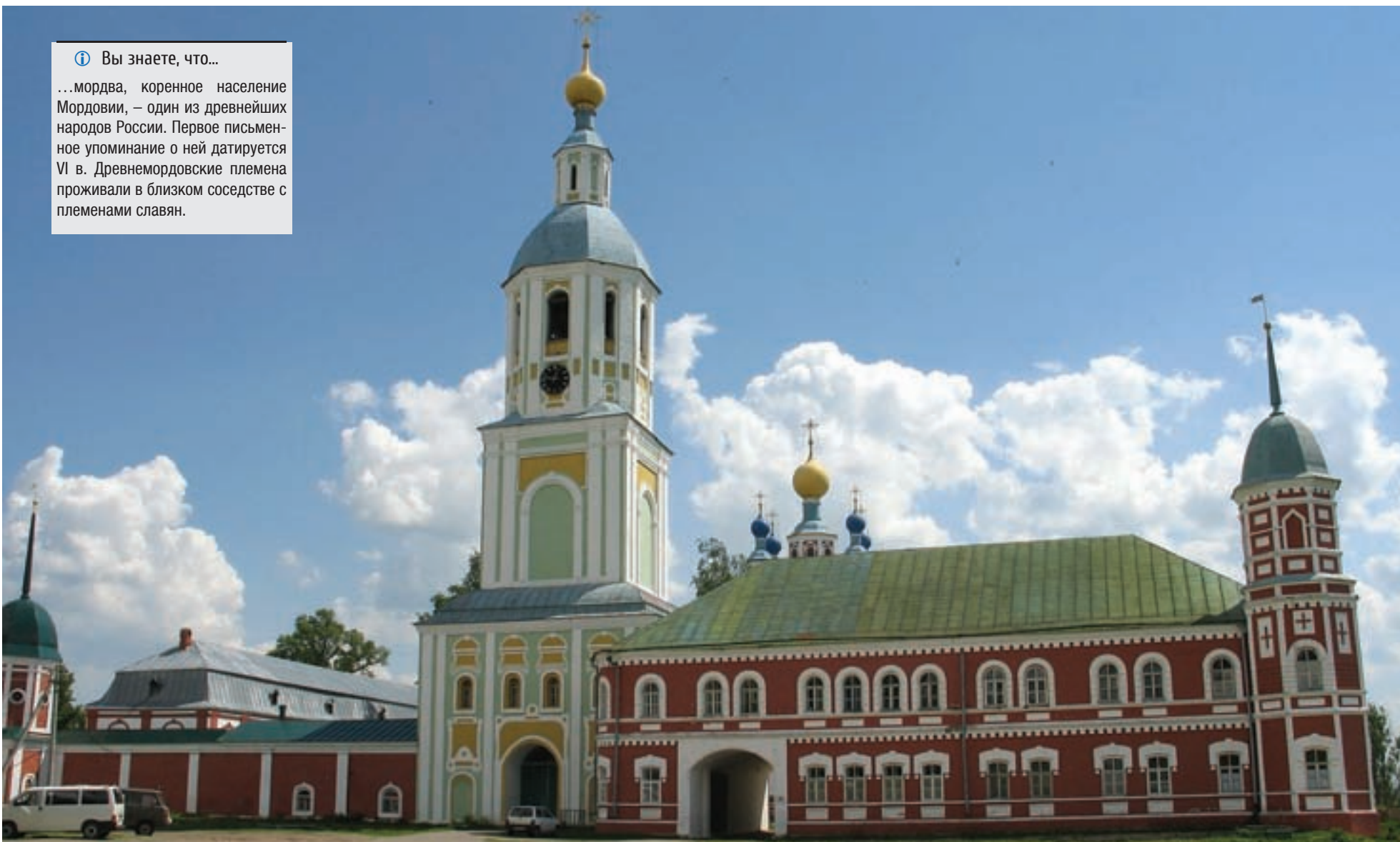
Санаксарский монастырь.

...мордва, коренное население Мордовии, – один из древнейших народов России. Первое письменное упоминание о ней датируется VI в. Древнемордовские племена проживали в близком соседстве с племенами славян.