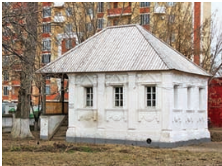
Саранск. Пугачёвская палатка.