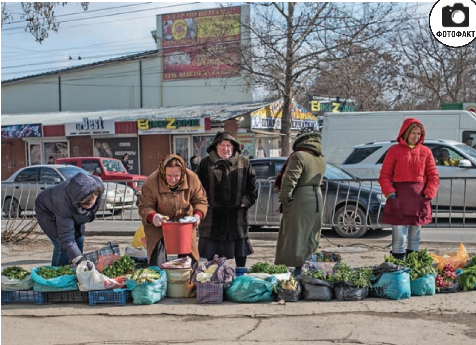
Симферополь, угол улиц Козлова и Севастопольской. Если со стихийщиками борются на одном углу, они перемещаются на другой.

Оформить подписку можно в любом отделении связи Крыма