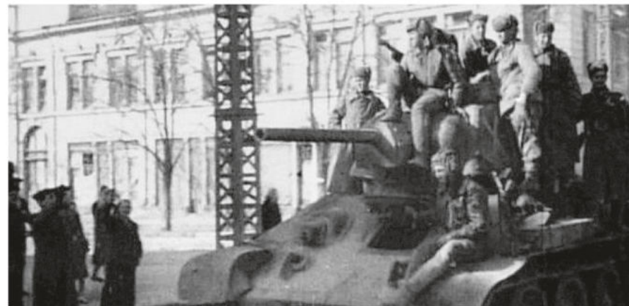
Апрель 1944 года. ОТ-34 на улице освобождённого от фашистов Симферополя.

отдельный огнемётно-танковый батальон. Его формировали, вооружали и комплектовали в Люберцах под Москвой. На долгие годы этот населённый пункт стал его пунктом постоянной дислокации. Это единственная воинская часть, штатно вооружённая огнемётными ОТ-34, которая сражалась за освобождение Крыма во время наступательной операции 1944 г.