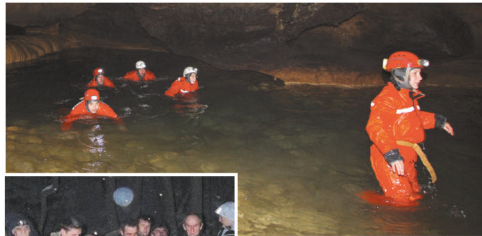
Смельчаны пробираются в водах Красной пещеры.

Процесс подготовки начинается с переоблачения участников. Просто переоблачением это назвать никак нельзя, поскольку со стороны действие напоминает некий обряд, символизирующий