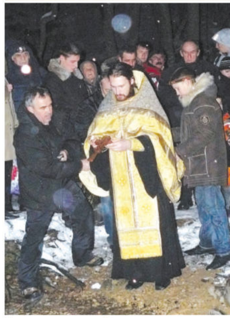
Многие крымчане на Крещение приезжают окунуться в Кизилкобинке.

готовность перехода из одного состояния в другое... Говоря проще, поскольку в пещере довольно холодно и очень мокро, участники микроэкспедиции в Зазеркалье должны быть правильно одеты. Помимо тёплых нательных вещей, на каждого надевают гидрокостюм. Он сделан из тонкой плотной резины, и самостоятельно влезть в него не получится. Два человека сначала растягивают твои штаны, потом втискивают тебя в такую же куртку и напоследок стягивают специальным поясом. Чтобы не порвать его об острые натёки, сверху надеваешь комбинезон, на ноги – резиновые сапоги или туристские ботинки, на голову – каску, на пояс – шахтёрский фонарь.