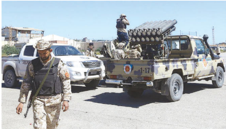
Армия Хафтара обвинила Правительство национального согласия Ливии в нарушении перемирия.

Противостоит Хафтару признанное ООН Правительство национального согласия (ПНС) во главе с 59-летним Фаизом Сарраджем. Этот политик – сын министра в правительстве короля Идриса I, которого и сверг Каддафи в 1969 году. В копилке сильных сторон ПНС – поддержка стран Евросоюза и, что ещё более важно, Турции. Но слабая сторона правительства – малочисленные и плохо организованные вооружённые силы. По этой причине