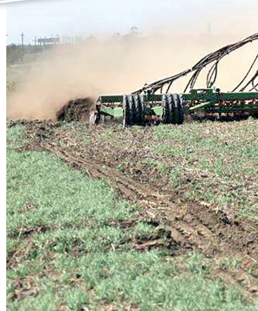
А в Крыму, на фоне золотых полей рапса, крымчане и туристы любят фотографироваться в мае.

Рапс – удивительное растение, улучшающее структуру почвы. Оно уменьшает засорённость полей, способствует накоплению органического вещества в земле, а значит, повышает урожайность последующих культур, особенно зерновых.