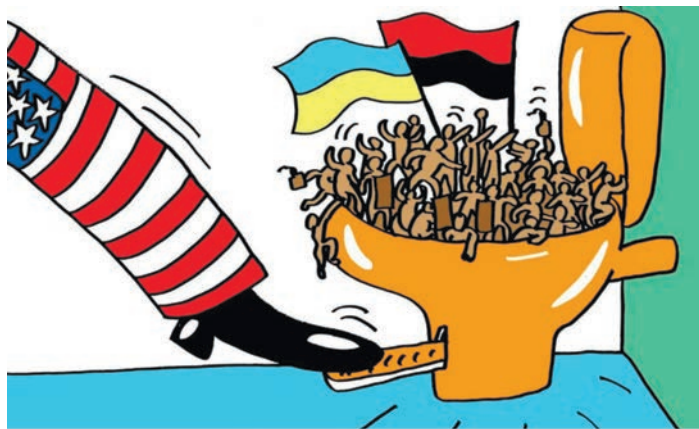
Карикатура: телеграм-канал «Нос»

ОТВЕТЫ: ПО ГОРИЗОНТАЛИ: 1. Акан. 5. Кака. 9. Руна. 10. Икар. 11. Ардс. 12. Лентс. 13. Каравелла. 15. Ода. 16. Аян. 17. Армани. 20. Окара. 25. Дада. 27. Стор. 28. Алаша. 30. Еда. 31. Трип. 33. Галактика. 38. Амур. 39. Атра. 40. Лира. 41. Кинт. 42. Одак. 43. Авто. ПО ВЕРТИКАЛИ: 1. Арак. 2. Кура. 3. Андromeда. 4. Насада. 5. Киле. 6. Арга. 7. Капша. 8. Арсан. 14. Ванс. 17. Ада. 18. Риал. 19. Икс. 22. Агери-тив. 23. Род. 24. Ара. 26. Апшарак. 29. Арк. 32. Итака. 33. Лаго. 34. Амид. 35. Аура. 36. Кант. 37. Арго.