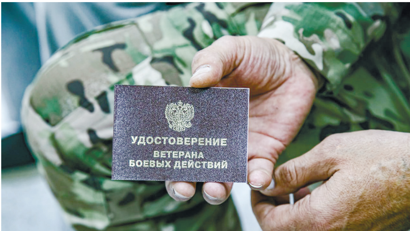
Фото: Михаил ГЛАДУК