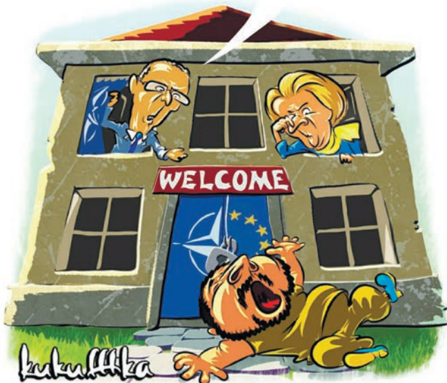
Карикатура: телеграм-канал «Kukuffka»

ЛЕЖИТ У ВХОДА ПРОСРОЧКА КАКАЯ-ТО И ВОНЯЕТ