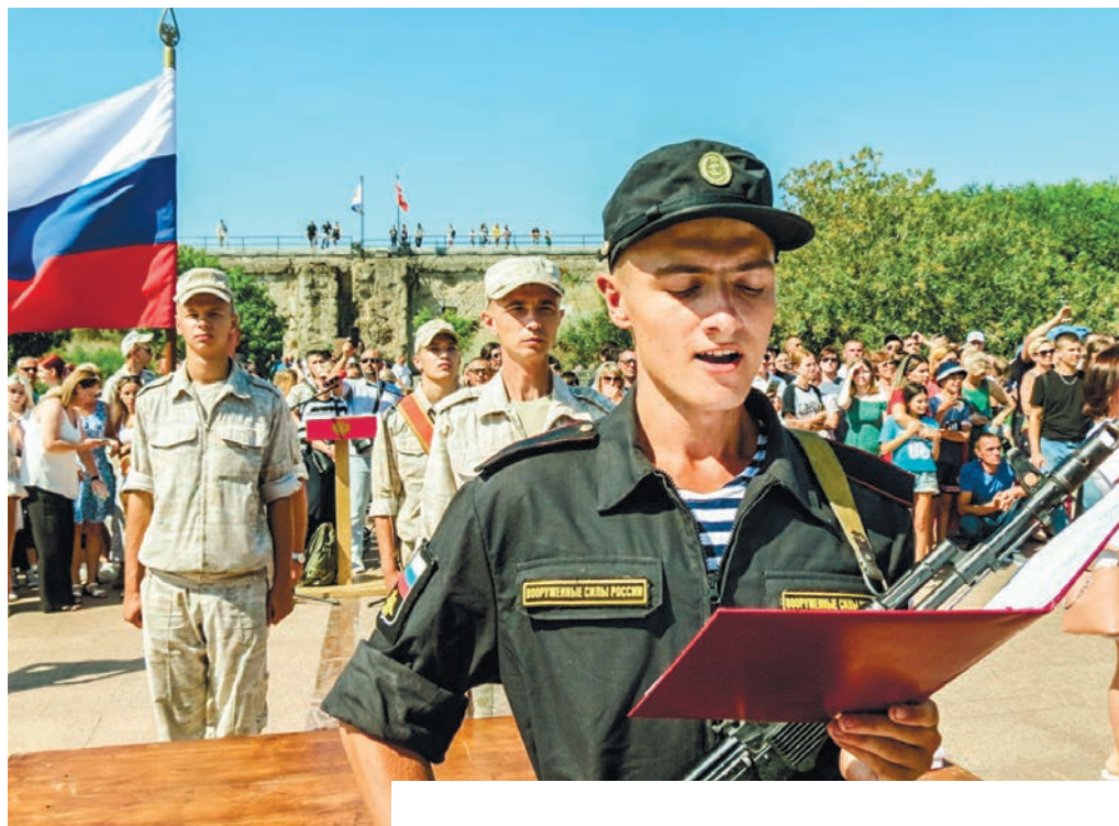
Морские пехотинцы ЧФ принимают военную присягу на 35 батарее.

Традиция приведения военнослужащих к военной присяге, основанная указом Петра I от 21 ноября 1721 года, продолжилась в стране и в последующие века.