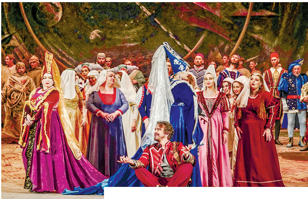
Сцена из театральной мистерии «Кармина Бурана».

Крымскому зрителю были представлены опера «Князь Игорь» Александра Бородина и театральная мистерия «Кармина Бурана» Карла Орфа.