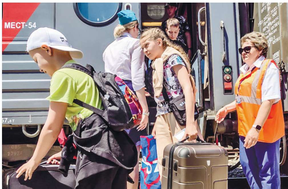
К месту отдыха юные белгородцы прибыли на поезде.