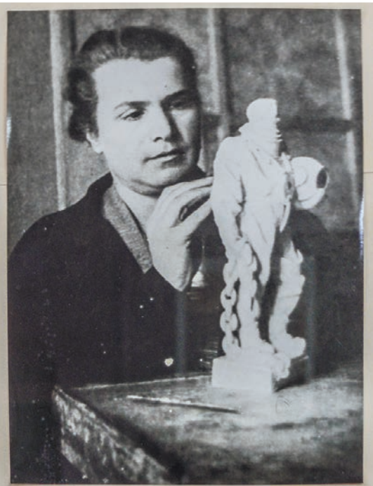
В. МУХИНА РАБОТАЮЩАЯ НАД МОДЕЛЬЮ СКУЛЬПТУРЫ «ЭПРОНЕВЕЦ» 1930-Е ГОДЫ

Вера Игнатьевна Мухина (1889–1953) – советский скульптор-монументалист, автор произведений, признанных эталоном социалистического реализма.