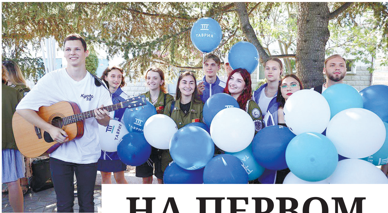
Пятнадцатимиллионного пассажира на перроне крымской столицы встретили студотряды с песнями под гитару и подарками.