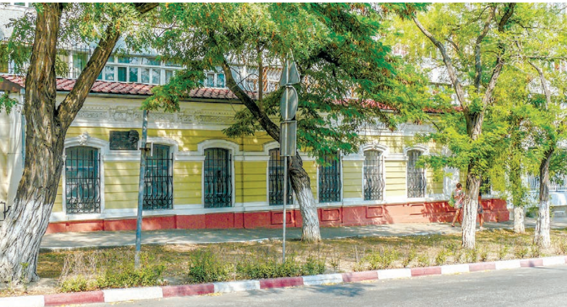
За фасадом старинного особняка расположен феодосийский музей народного художника СССР Веры Мухиной.

промышленная посудомоечная машина. Однако хрупкие стаканы железной хватки не выдерживали, и в их конфигурацию потребовалось внести важные изменения. Академик прекрасно справилась с задачей. В частности, поместила по верхнему краю