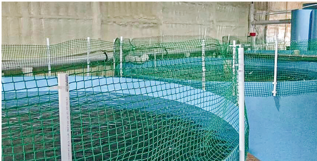
В таких специальных бассейнах выращивают мальков форели на одном из крымских предприятий.

– Предприятие является инновационным не только для Крыма, но и в целом для России. Его пиковая мощность рассчитана на 5000 тонн. В планах выращивание товарной форели массой более четырёх килограммов. Производственный цикл планируется организовать путём кооперации нескольких участников. Сегодня произ-