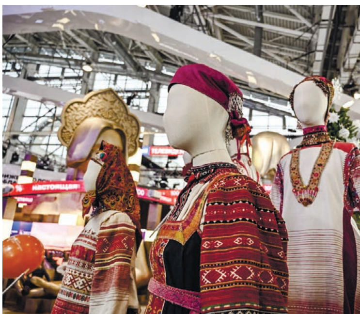
Республика продемонстрировала разнообразие народностей и их традиций.