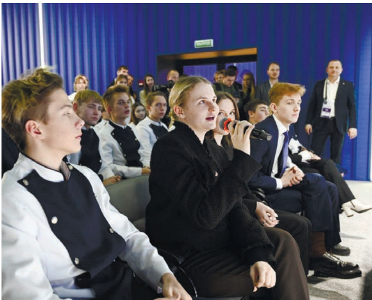
Встреча со студентами из Крыма, которые обучаются в московских вузах, проходила в тесном формате.