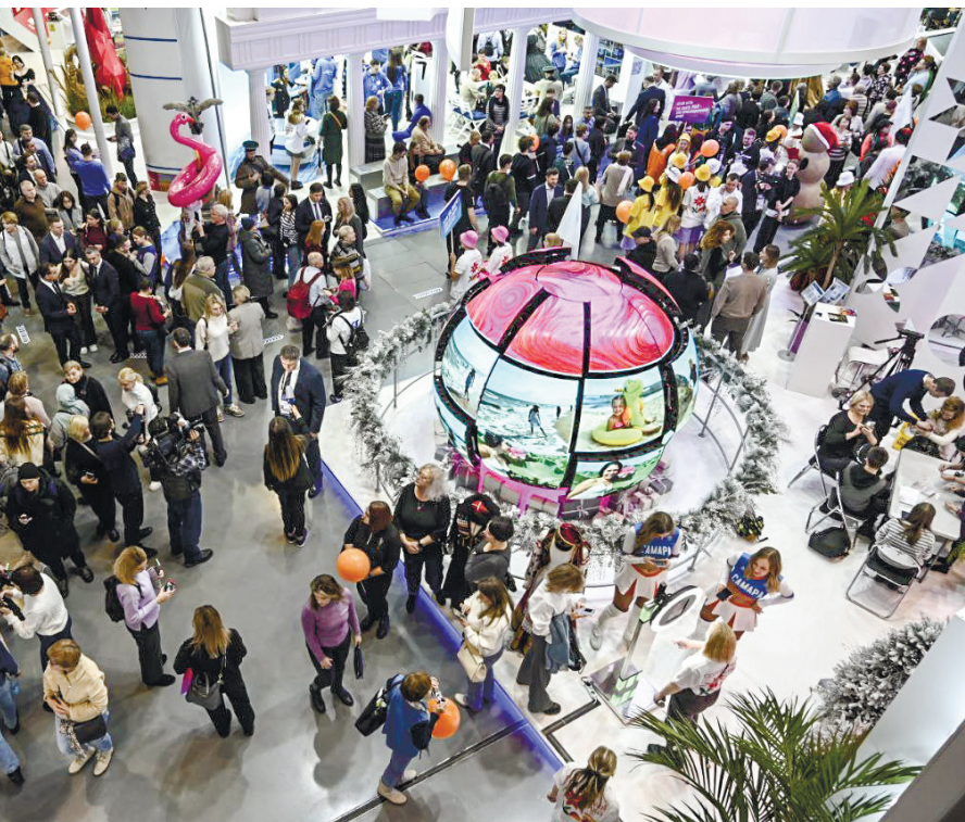
Крымский стенд стал одним из самых популярных на форуме «Россия».