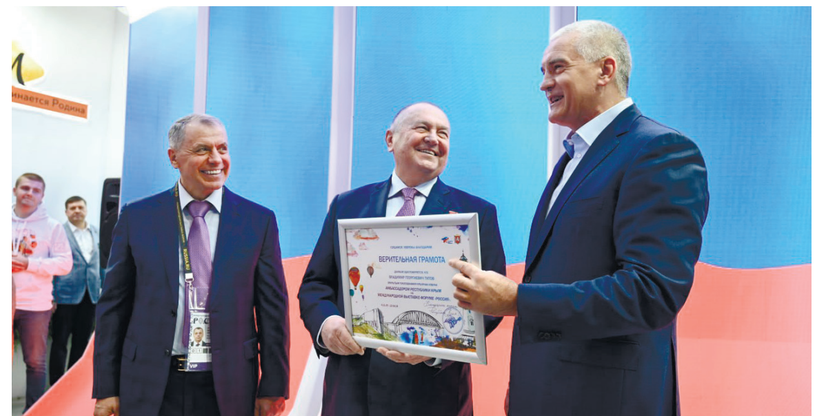
Сергей Аксёнов и Владимир Константинов вручили верительную грамоту амбассадору, почётному представителю республики, лётчику-космонавту Владимиру Титову.

Так что крымчане и в заснеженной Москве принимают тепло и душевно.