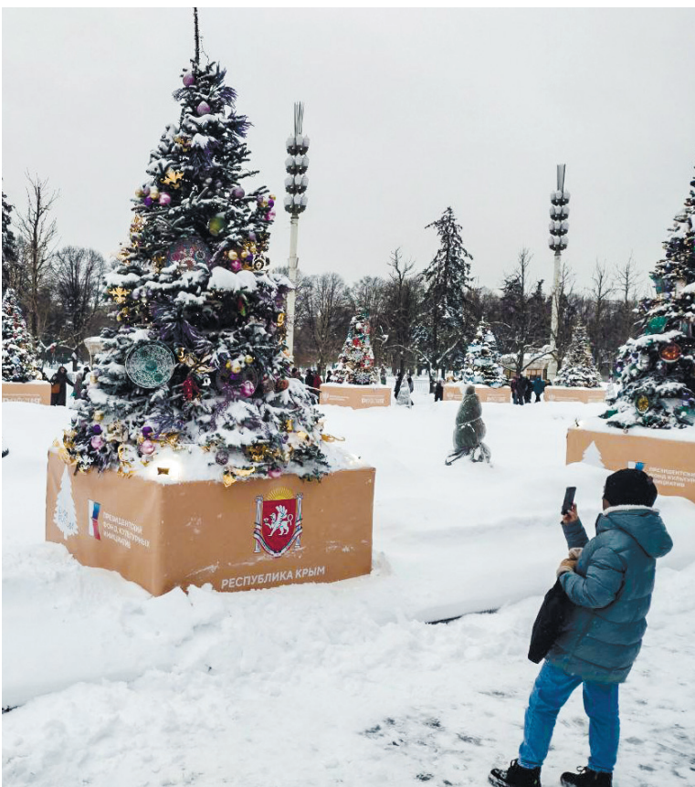
На площадке ВДНХ красовалась и крымская ёлочка.