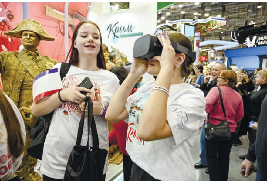
На стенде Крыма в Москве можно «полетать» над полуостровом с помощью VR-очков.