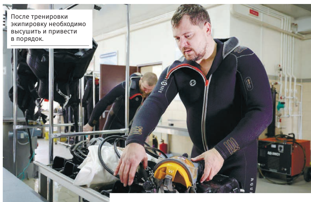
После тренировки экипировку необходимо высушить и привести в порядок.

обходимое для выполнения работ. Спасение на воде осуществляется спасателями-матросами. Если дело дошло до работы водолазов, значит, всё самое плохое уже случилось. Мы проводим подводно-поисковые работы и обследование подводных сооружений и объектов, – говорит он.